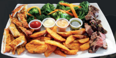
Lomito y pollo en bocas