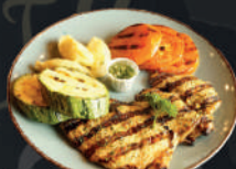
Pollo a la parrilla, puré y vegetales