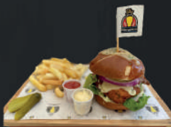
Schnitzel Burger con papas