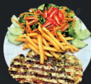
Pollo con papas fritas y ensalada