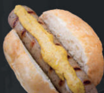
Choripan alemán - Picante - Bratwurst