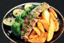
Lomito 180gr. a la parrilla

Con papas en gajo, verduras y chimichurri