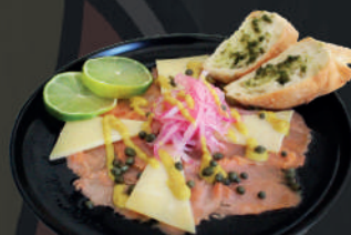
Carpaccio de Salmón