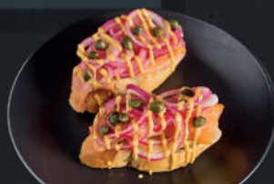
Bruschettas de Salmón