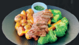
Lomo de aguja 180gr. a la parrilla