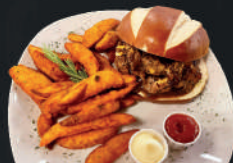
Hamburguesa de lomito