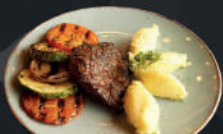
Lomo de entraña a la parrilla, puré y vegetales