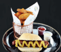
Chorizo alemán picante con pan y papas