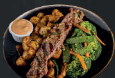
Lomito 180gr. a la parrilla

Con papas mini, verduras y mantequilla de hierbas