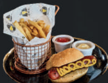
Salchicha alemana 150gr en pan con papas a la francesa