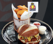
Hamburguesa de cerdo mechado y Sauerkraut