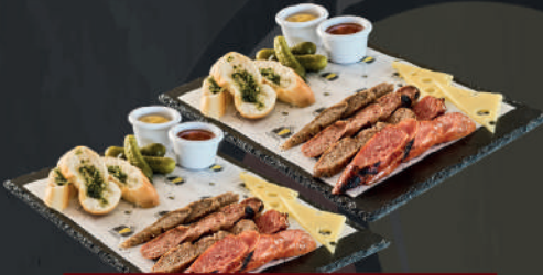
Dos tablas de salchichas alemanas variadas