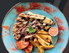
Variado de: entraña, pollo y chorizo