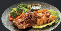
Entraña 180gr. a la parrilla