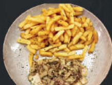
Punta de solomo en salsa de hongos y vino