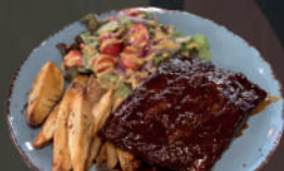
Costillas St. Louis con papas y ensalada