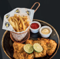
Schnitzel de pollo empanizado con papas a la francesa