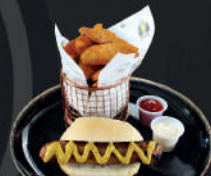
Bratwurst con pan y papas