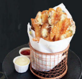
Papas Parmesano Romero