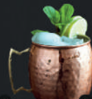
Moscow Mule €4.800